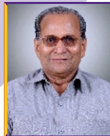
श्री. केसरीनाथ बा. घरत तज्ञ संचालक (बी.ए.सी.ए.आय.आय.बी.पार्ट-1)